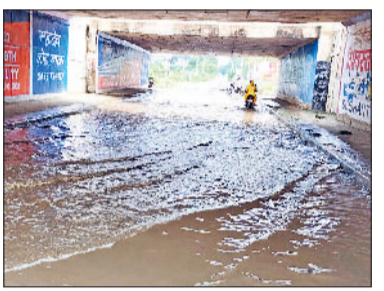
खरखोदा। अंडरपास में भरा हुआ पानी।

खरखोदा। शहर के थाना कलां बाईपास 334-बी पर अंडरपास में व आसपास लंबे समय से जलभराव होने के कारण राहगीरों को भारी परेशानी का सामना करना पड़ रहा है। थाना कलां मार्ग पर बने नाले का पानी ओवर फ्लो होकर सड़क पर आ जाता है, जिससे पूरा मार्ग जलमग्न रहता है। पानी भरने के कारण सड़क की हालत भी काफी खराब हो चुकी है और जगह-जगह गड्ढे बन गए हैं। स्थानीय लोगों के अनुसार, फिसलन भरी सड़क के चलते कई वाहन चालक घायल भी हो चुके हैं। लोगों ने बताया कि नगर पालिका के अधिकारियों को बार-बार शिकायत देने के बावजूद समस्या का समाधान नहीं हुआ है। लोक निर्माण विभाग व नगर पालिका दोनों विभागों को लापरवाही का खामियाजा आमजन को भुगतना पड़ रहा है। स्थानीय नागरिकों का कहना है कि बारिश होने पर स्थिति और भी गंभीर हो जाती है। लोगों ने प्रशासन से जल्द से जल्द जलभराव की समस्या का स्थायी समाधान करने की मांग की है।