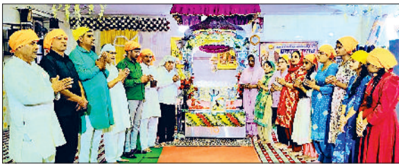
गोहाणा। बंदा सिंह बहादुर के चित्र पर पुष्प अर्पित करके नमन करते हुए नागरिक।