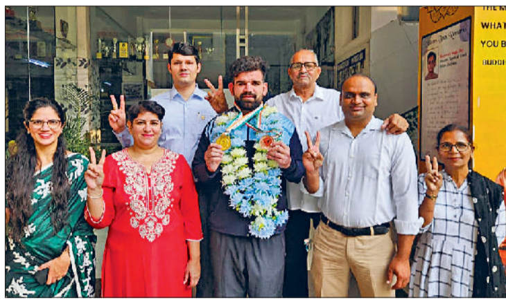
खरखौदा। पदक विजेता का स्वागत करते हुए प्रताप स्कूल प्रबंधन।