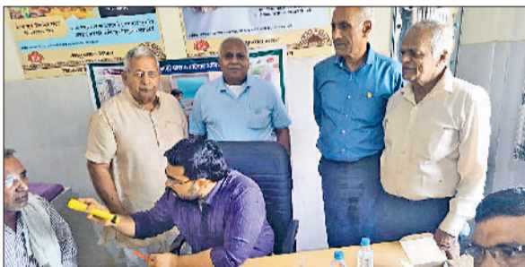
सोनीपत। शिविर में मरीजों के नेत्रों की जांच करते हुए चिकित्सक।

कारागार के बंधन खुल गए और वसुदेव उन्हें यमुना पर गोकुल पहुंचा आए, जहां नंद बाबा और यशोदा माता ने उनका पालन-पोषण किया। गोकुल में बालक श्रीकृष्ण ने अनेक चमत्कारी