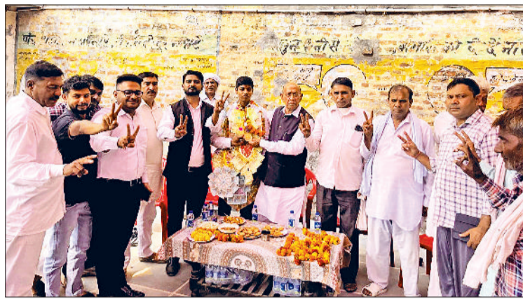
विजेता खिलाड़ी का स्वागत करते हुए पूर्व सांसद एवं अन्य।